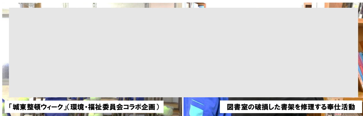
「城東整頓ウィーク」（環境・福祉委員会コラボ企画）