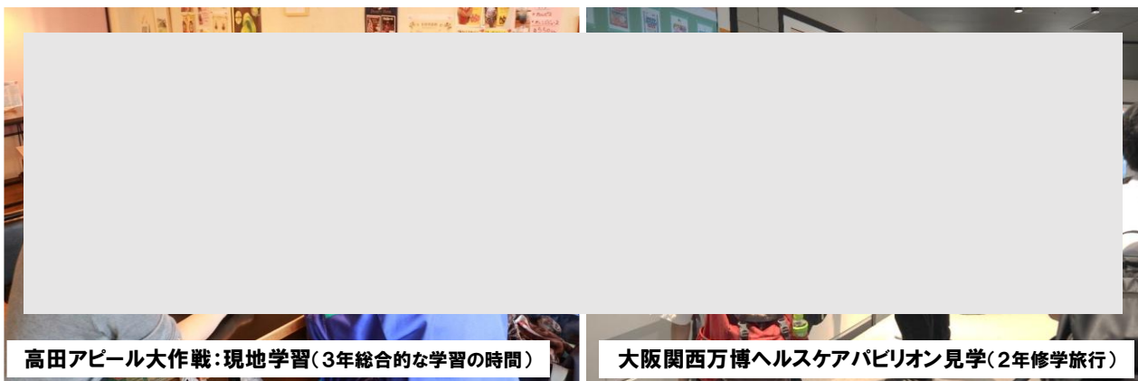
高田アピール大作戦：現地学習（3年総合的な学習の時間）