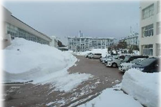
赤レンガの様子。体育館脇は大きな雪山となっています