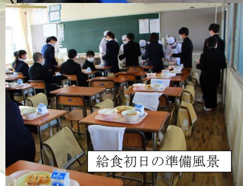
給食初日の準備風景

新型コロナウイルスの影響で、何かと不安の多い中で、新年度のスタートでしたが、「当たり前」のことを「当たり前」にできる「こと」のありがたさを感じながら、「チーム城東」のみんなはとてよよいスタートを切っています。行事や部活動だけではなく、より「日常」を大切に学校生活を送ることが出来る集団への成長が伺えます。