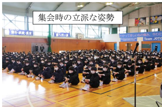
集会時の立派な姿勢