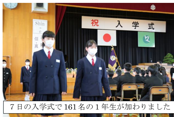
7日の入学式で161名の1年生が加わりました

変化の激しい社会への対応に加え、今までに経験したことがない危機への対応を迫られています。先が見通せない課題が山積する社会ではありますが、将来を担う子どもたちを確実に成長させることは、我々大人の責務です。保護者や地域の皆様からも『チーム城東』の一員として、子どもたちの健やかな成長のために、ご支援、ご協力いただきますようお願いいたします。