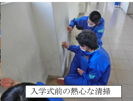
入学式前の熱心な清掃