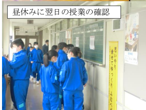
昼休みに翌日の授業の確認